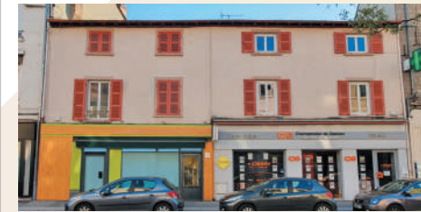
Projet de façade, photo non contractuelle.

Maître d'ouvrage : CLEATYS CLEATYS 58, Av de LANESSAN 69410 Champagne- au-Mont-d'Or