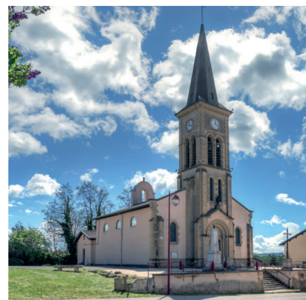
L'église Saint-Clair possède un portail roman et un chœur du 15 ème siècle