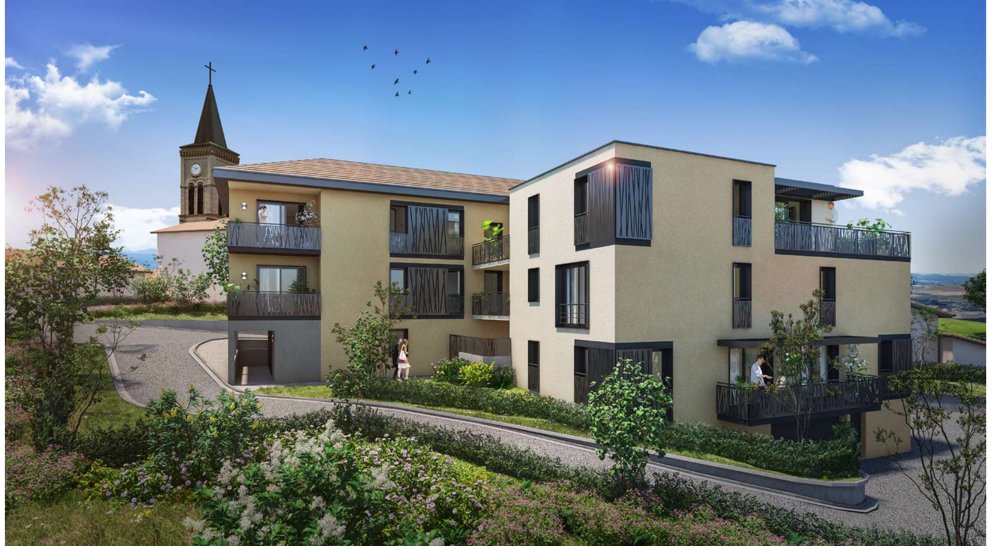
Particulièrement confortables, les logements de la résidence possèdent tous leur singularité

Entre Culin et Bourgoin, à seulement 10 mn, vous n'aurez pas le temps de stresser : sur votre trajet, seule la nature vous accompagnera !