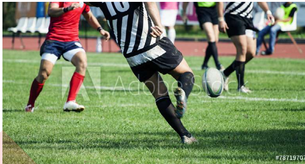
Ici, le club de rugby ravit les grands et les petits