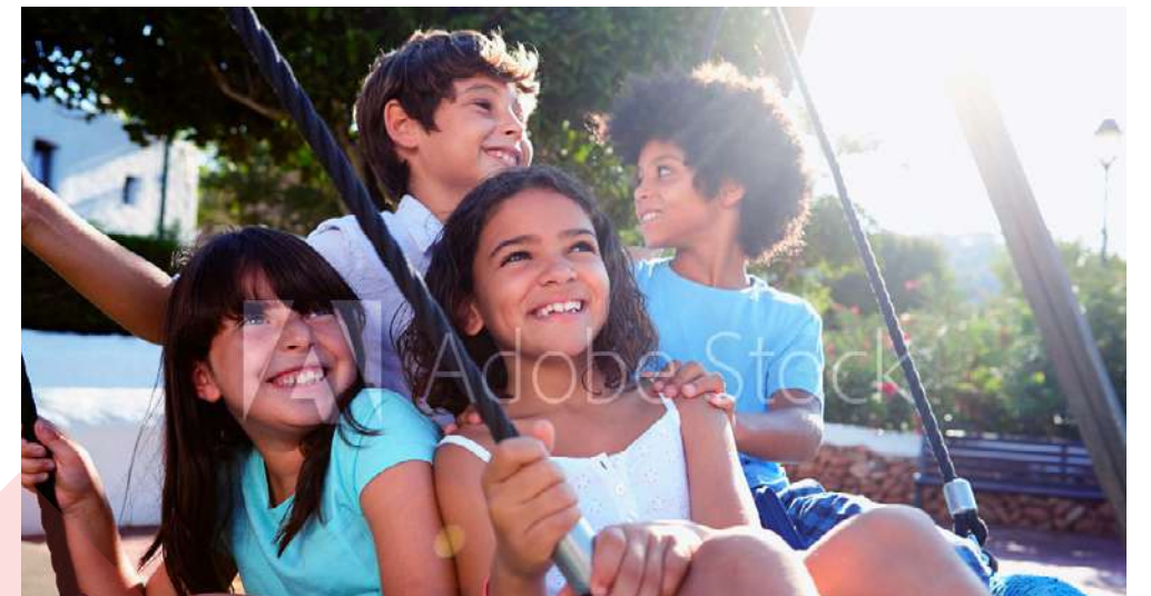
Grandir à la campagne... à proximité des plaisirs de la ville